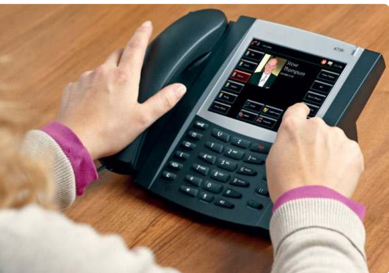
Avec son grand écran tactile couleur, le téléphone SIP Mitel 6739 apporte tout le confort de la téléphonie sur votre bureau.

Le concept d'utilisation du Mitel se caractérise par un grand confort et des menus intuitifs sur tous les terminaux. Inutile pour cela de passer des heures à étudier les manuels. La structure intelligente, qui repose sur le concept de touche Fox, propose automatiquement les fonctions adaptées à l'état actuel. Résultat : 90 pour cent des fonctions souhaitées peuvent ainsi être atteintes dès le premier affichage. Les principales options sont indiquées en haut de la liste.