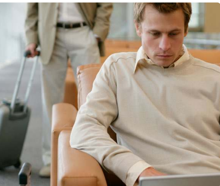
Mobile mais joignable : avec Mitel, c'est possible.

Les abonnés internes sont joignables tout simplement par leur numéro d'appel interne. Les appels entrants et sortants passant par le numéro de fixe de l'entreprise (concept One Number), le numéro du téléphone mobile reste «secret».