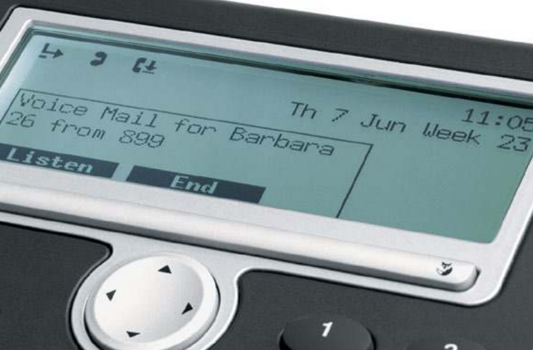
Les messages vocaux qui n'ont pas encore été écoutés sont affichés – ici sur l'écran du MiVoice 5380.