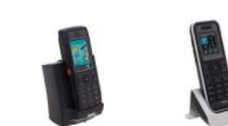
Terminaux 500 DECT/500EX DECT

Pour les communications mobiles dans l'entreprise