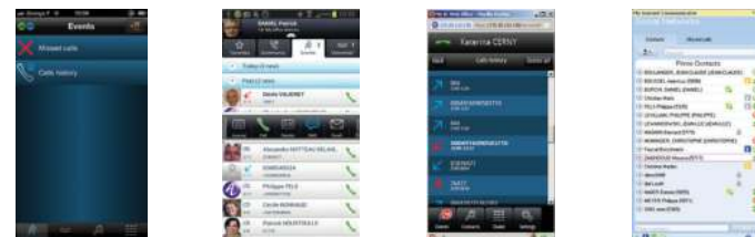
My IC Mobile pour iPhone

Des solutions de communication qui vous permettent de gagner en productivité et de rester connecté en permanence à votre travail, où que vous soyez